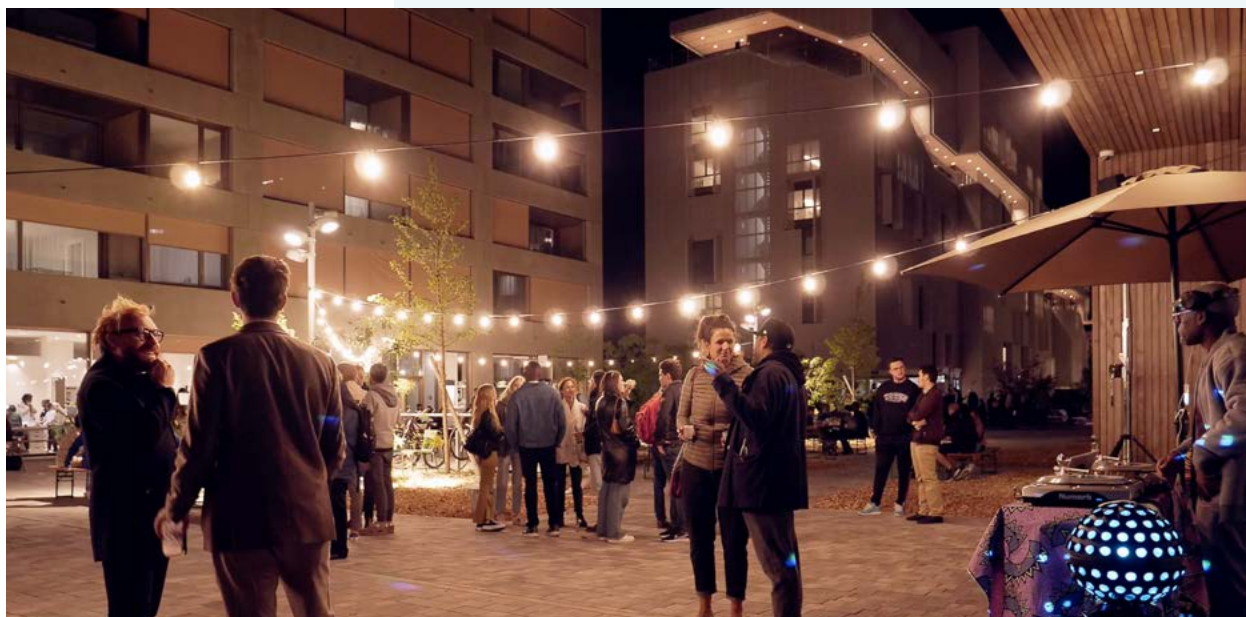
Ambiance fête de quartier en soirée à la Cité internationale du Grand Morillon